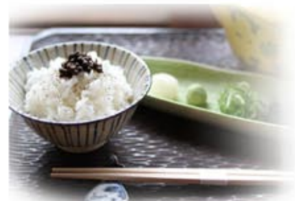
胡椒飯、芝蘭菽乳（豆腐料理） 茄子とするめ油煮など

そして演目の合間に、江戸時代に親しまれていた竹酒と冷やし甘酒、江戸の食事を再現した酒肴を準備しておりますのでお楽しみ下さい。